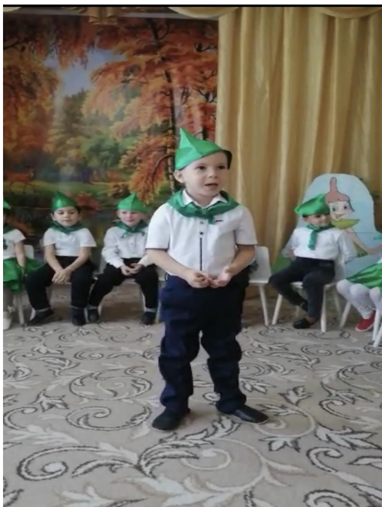
Читает стихотворение Умница «Недалекое будущее»